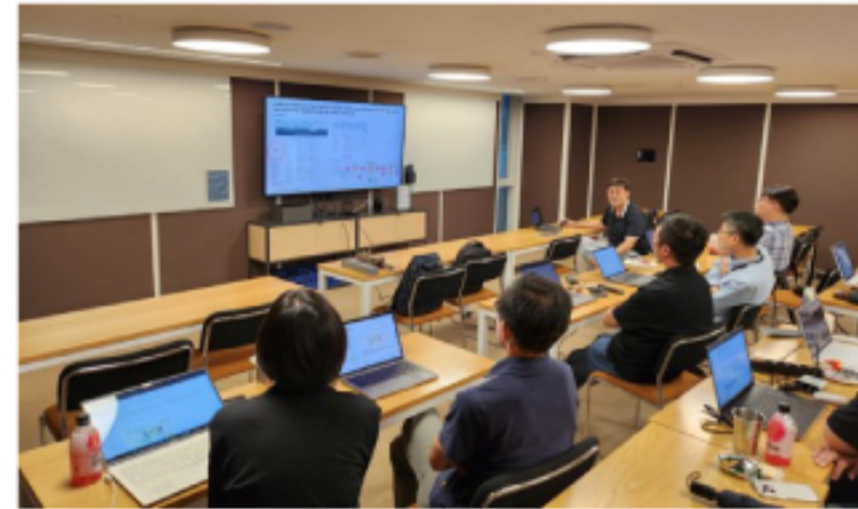
Dynatrace Partner Engineers PowerUp Session 사진

- 총 4곳의 파트너사, 총 8명의 엔지니어가 참여하여 쿠버네티스 문제 해결, 비즈니스 분석 방법론, 그리고 서비스로서의 소프트웨어(SaaS) 및 관리형 서비스에 대한 깊이 있는 토론을 진행했습니다.