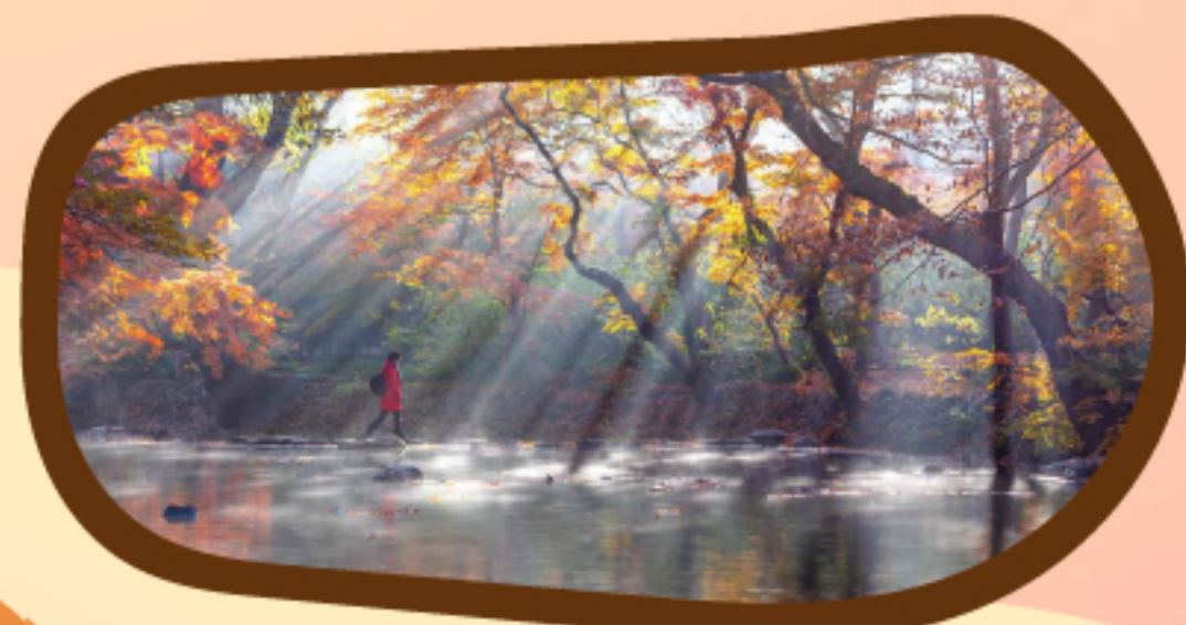
도솔계곡 옆 숲길