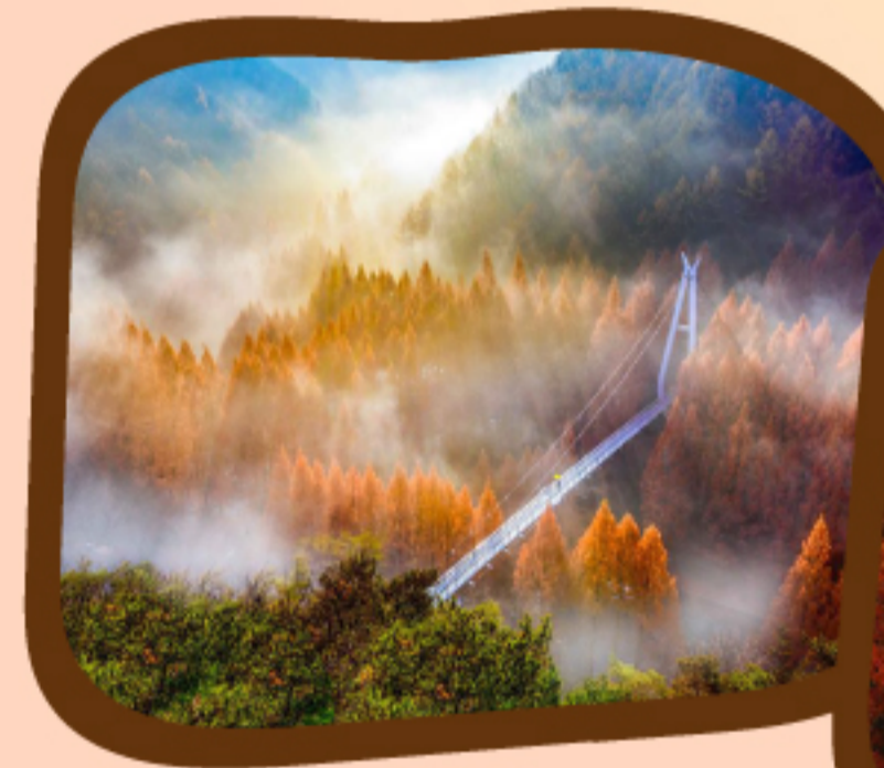
울창한 메타세쿼이아 숲