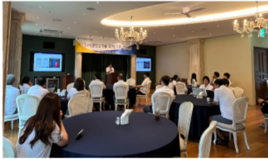
2024년도 리더그룹 워크샵 사진