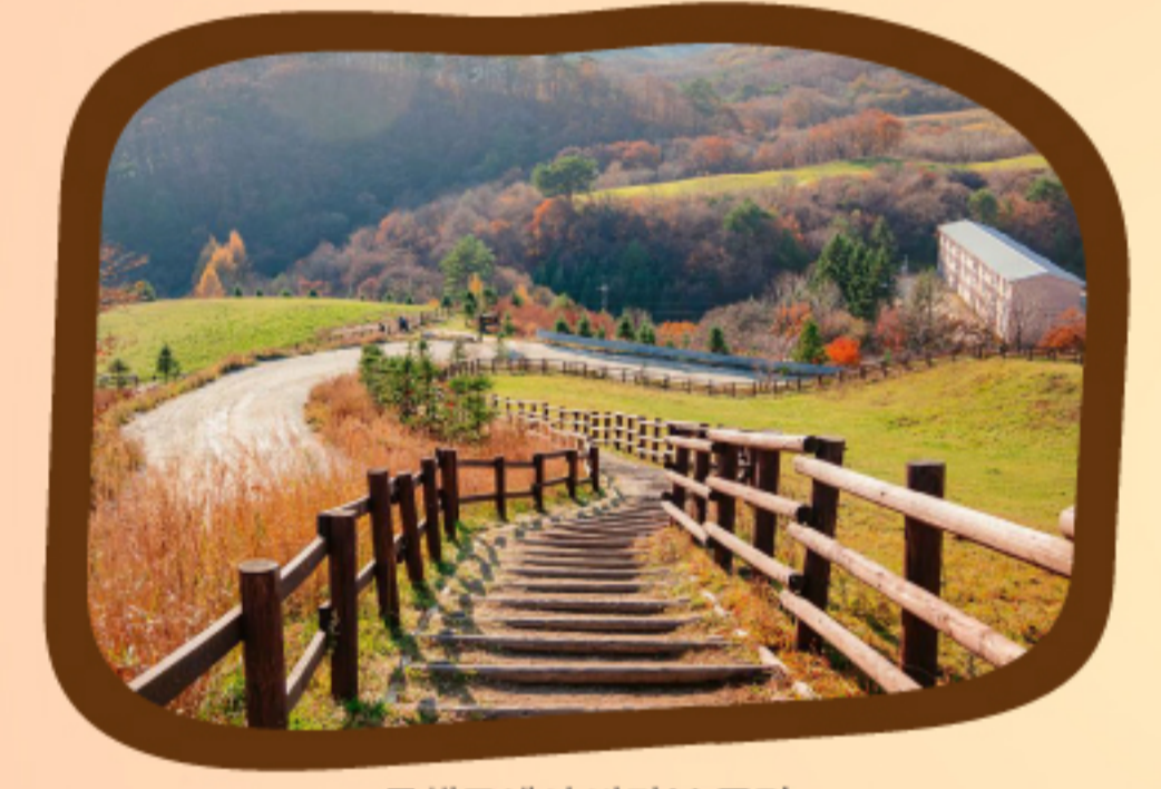
목책로에서 바라본 풍경

[삼양라면]의 그 삼양, 맞아요. 라면과 유제품으로 유명한 삼양식품에서 운영하는 여의도 7.5배 면적의 목장으로 대관령 고산 지대에 자리해 가을이면 단풍 든 산 능선이 파노라마처럼 펼쳐집니다. 단풍 포인트는 셔틀버스를 타고 동해전망대(해발 1,140m)에 오르면 가깝고 먼 산들의 능선에 화려한 단풍이 번지는 모습에 감탄이 터질 거예요. 1구간 [바람의 언덕]의 나무 계단, 동명의 영화에도 나온 3구간의 [연애소설 나무]는 포토존으로 유명하니 방문하시면 예쁜 인증샷 남기는 것과 목장에서 생산하는 원유로 만든 아이스크림 맛보는 거 잊지 마세요.