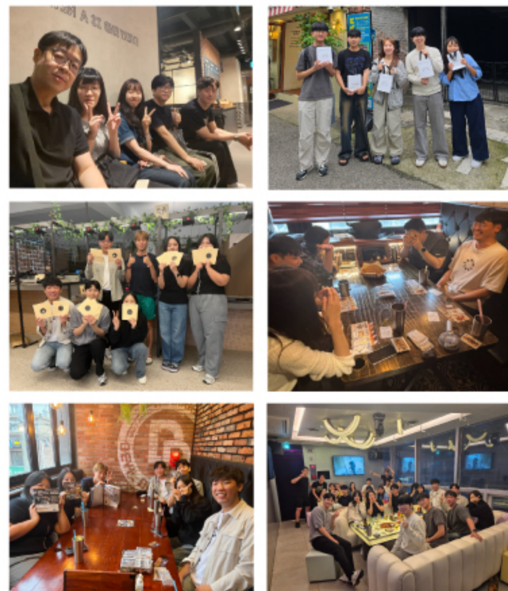
BI본부 Meeting Day 사진