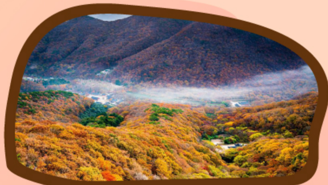
선운산 가을 풍경

사뻐사뻐 걸어 단풍 구경을 하고, 소슬한 가을바람 맞으며 호젓한 숲길을 걷고 싶다면 선운사로 향하세요. 가람 옆 도솔계곡을 품은 숲길에선 단풍과 기암이 어우러진 절경을 볼 수 있습니다.