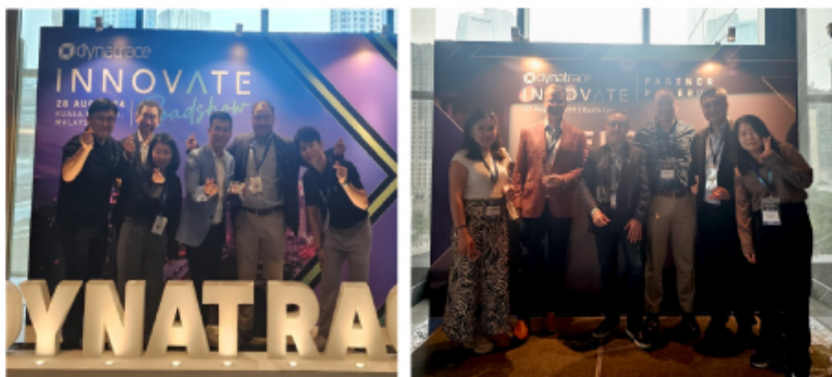
Dynatrace Partner PowerUp, Innovate Roadshow 사진